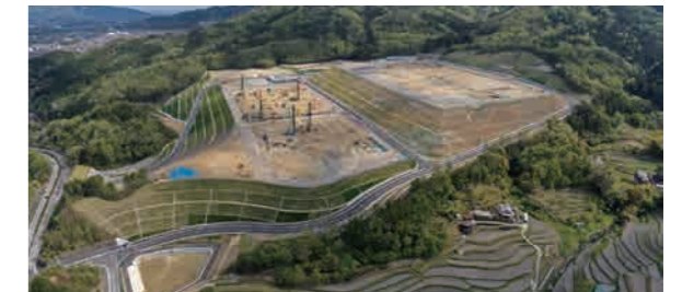
造成工事完了時撮影(2020年4月)

本社所在地： 東京都千代田区神田錦町三丁目7番1号興和一橋ビル ※1922年創立の総合建設コンサルタント企業