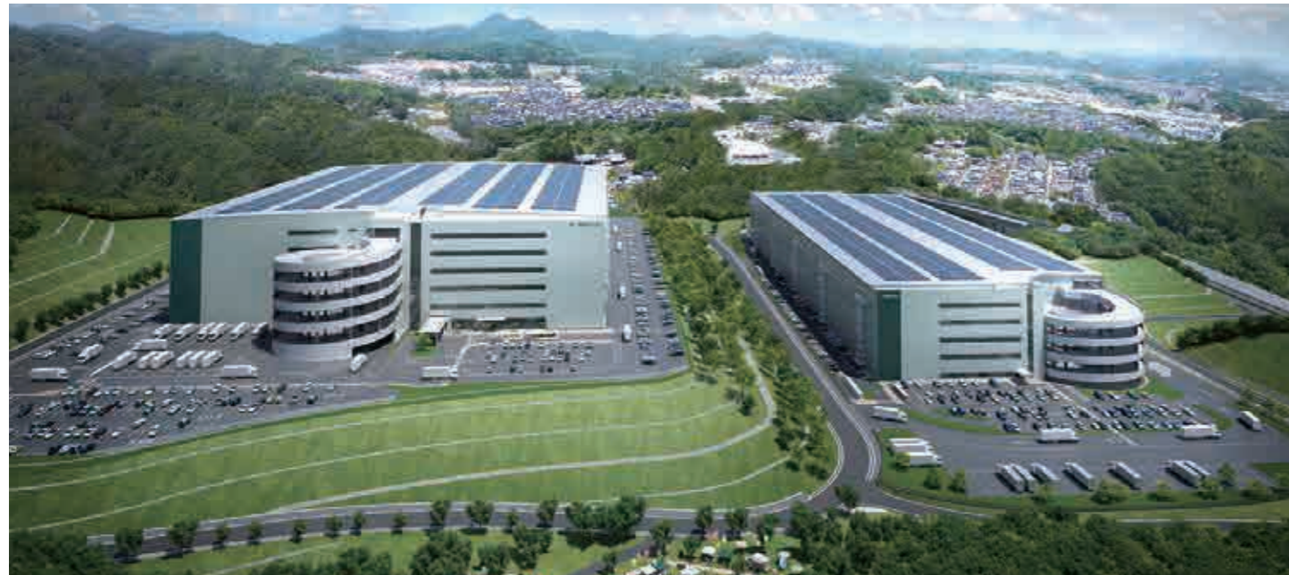
写真は完成イメージです。計画は変更となる場合があります。